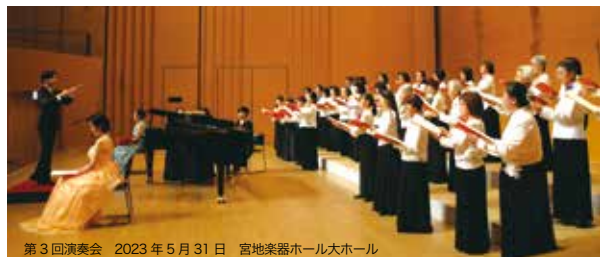
第3回演奏会 2023年5月31日 宮地楽器ホール大ホール