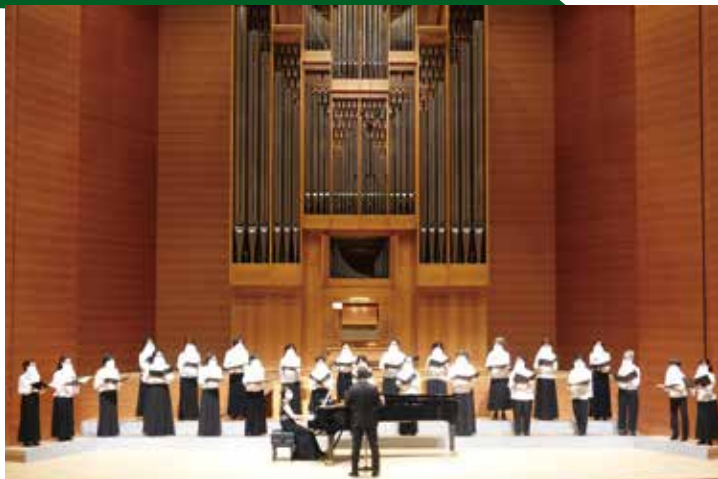
第2回演奏会 2021年5月8日 武蔵市民文化会館小ホール